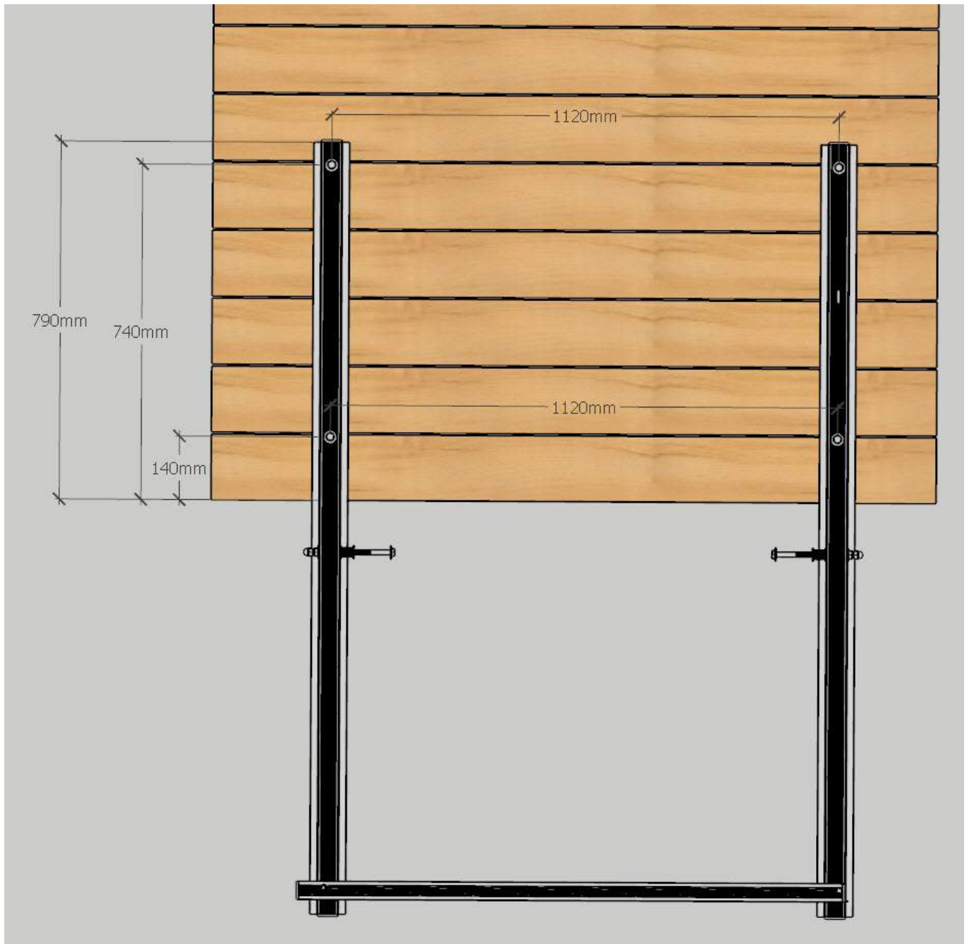
Kuva 2: Kuvassa pystyssä vaakatangot ja kuvan alareunassa poikittaistanko jonka varassa portaat lepäävät talven. Kuvassa mitat 85 cm leveille portaille. Vaihda mitat 65 ja 95 cm leveille portaille, yllä ohjeen kohta 1.