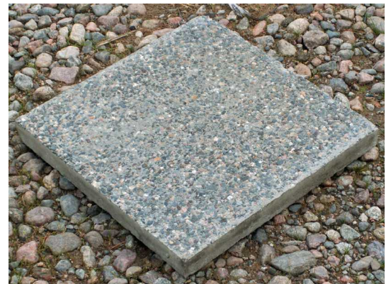
Pesubetonilaatta, "Luonnonkivi", pieniä pyöreäreunaisia kiviä. Vaihtelee eri valmistajilla.

PihaPolku elementteihin sopivat [tietääksemme] kaikkien valmistajien 40 x 40 cm laatat. Laattojen maksimimita saa olla 401 x 401 mm. Laattojen suositeltava paksuus on 45, 50 tai 55 mm. 40 mm paksuja pesubetonilaattoja ei suositella käytettäväksi. Kivilaatan, esim. graniittilaatan paksuudeksi sopii myös 40 mm. 45 mm paksu laatta painaa n. 19 kg / kpl.