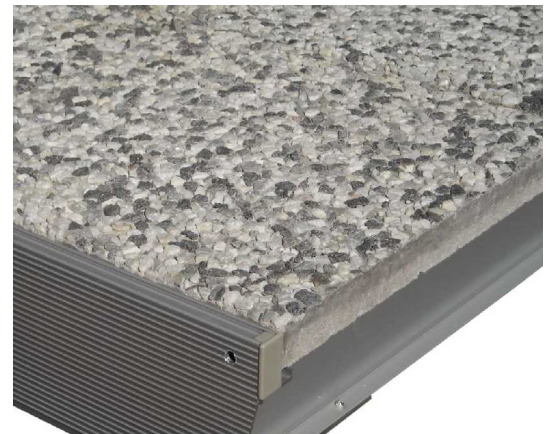
Pesubetonilaatta, "Musta-valkoinen", iso kivi-murska. Vaihtelee eri valmistajilla.