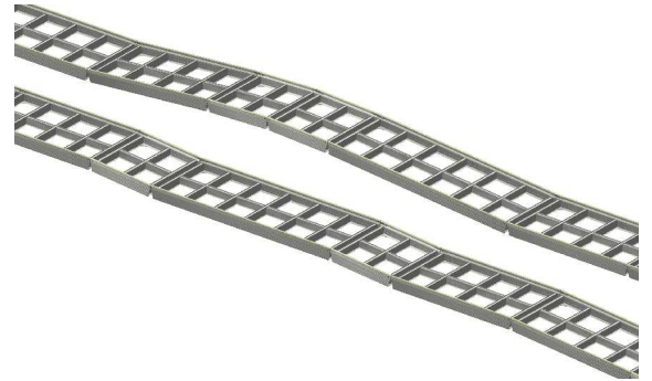
Ketjutettuja PihaPolku -aluWalk -elementtejä. Polku seuraa maan pinnan muotoja.