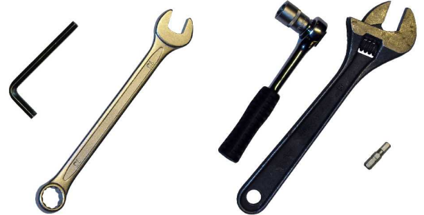
Tarvitaan: 5 mm kuusiokoloavain ja 13 mm väännin.